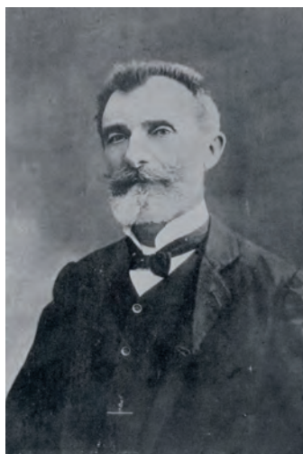
Fig. 9. Annibale Riccò (Archivio INAF-Osservatorio Astronomico di Palermo)

1890 venne istituita a Catania la prima cattedra di astrofisica, precedendo di quattro anni quella di Berlino, erroneamente considerata dalla storiografia corrente la prima in assoluto (Chinnici 2008a, p. 418). La cattedra catanese fu assegnata (ex art. 69 della Legge Casati) ad Annibale Riccò (1844-1919) (Fig. 9), amico ed erede scientifico dello stesso Tacchini, contestualmente alla direzione dell'Osservatorio Astrofisico di Catania.