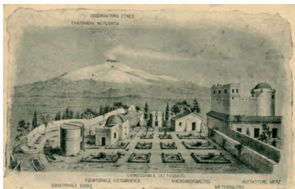
Fig. 8. L'Osservatorio Astrofisico di Catania

Nel 1890 l' Osservatorio di Catania (Fig. 8) acquisì la denominazione di Osservatorio Astrofisico , il primo in Italia ad essere denominato “astrofisico” anziché “astronomico”, quasi a voler indicare fin dal nome la natura delle ricerche che si sarebbero svolte, distinguendosi in tal modo dagli osservatori astronomici tradizionali.