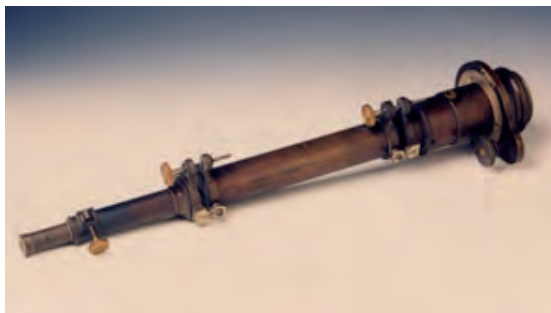
Fig. 5. Spettroscopio applicato all'equatoriale Merz e utilizzato da Tacchini per osservazioni solari

I risultati ottenuti con questo metodo, sia pure poco raffinato, 7 erano stati tali da indurlo a pensare che l'ipotesi potesse avere un fondamento; egli riteneva infatti di aver osservato delle variazioni nella posizione dei pennacchi, per cui si rendeva necessario effettuare altre osservazioni: soprattutto, Tacchini voleva tentare di fotografare la corona, in modo da avere immagini oggettive della sua forma.