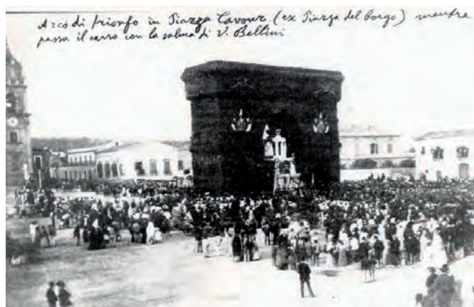
Fig. 6. Arco celebrativo per la solenne traslazione delle spoglie di Bellini a Catania

eseguire osservazioni astronomiche ad alta quota (Young 1872). Tacchini ritenne quindi di avere un ottimo argomento a favore per presentare la proposta di un osservatorio sull'Etna quattro anni dopo, nel 1876, in occasione delle celebrazioni per la traslazione delle ceneri del celebre musicista catanese Vincenzo Bellini (1801-1835) (Fig. 6), quando lo stesso Tacchini fu invitato a tenere una conferenza presso l'Accademia Gioenia di Catania.