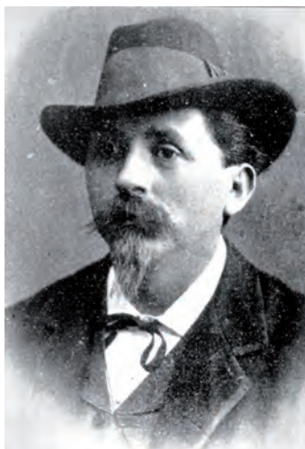
Fig. 3. Pietro Tacchini

Palermo, come Astronomo Aggiunto, il giovane Direttore dell'Osservatorio di Modena, Pietro Tacchini e nominare al suo posto il Direttore di Palermo, Domenico Ragona (1820-1892). Questi era subentrato a Cacciatore nel 1849, 4 dopo la sua rimozione dall'incarico di Direttore, ed era pertanto necessario per lui un onorevole allontanamento, una volta reintegrato Cacciatore nelle funzioni direttoriali.