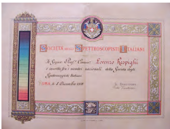
Fig. 4. Diploma della Società degli Spettroscopisti Italiani