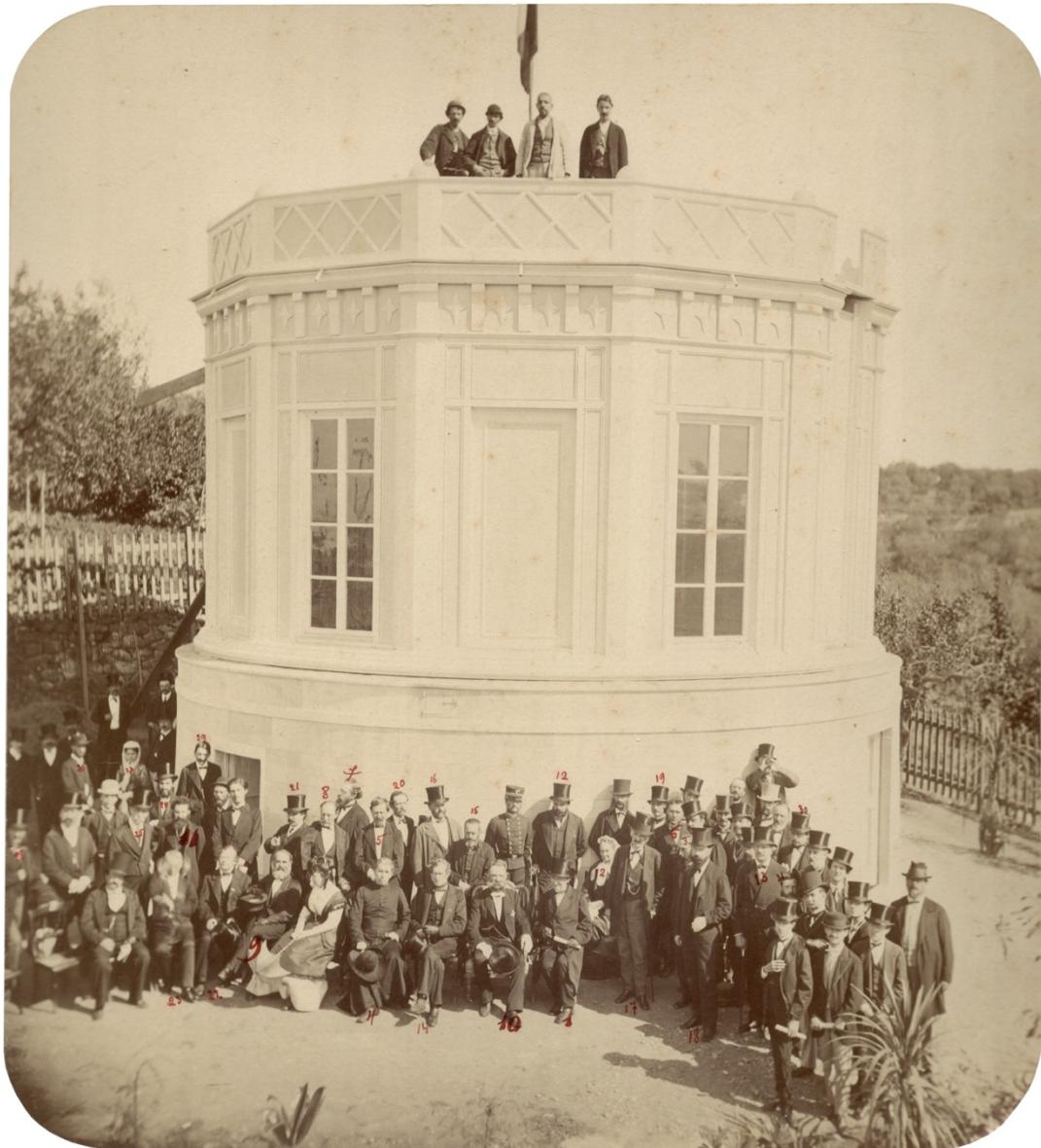
Fig. 1 La prima inaugurazione - 26 settembre 1869. Per l'identificazione di alcuni dei partecipanti si veda la Tabella 1 (Archivio Fotografico Osservatorio Arcetri).