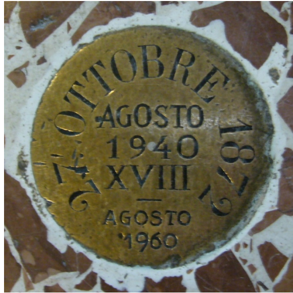
Fig. 7 Placca di ottone sul pavimento della sala centrale dell'Osservatorio. Oltre all'inaugurazione del 1872, riporta le date di due successivi interventi di ristrutturazione dell'Osservatorio. Saranno ancora qui sepolti i tubi di piombo con le pergamene delle due inaugurazioni?