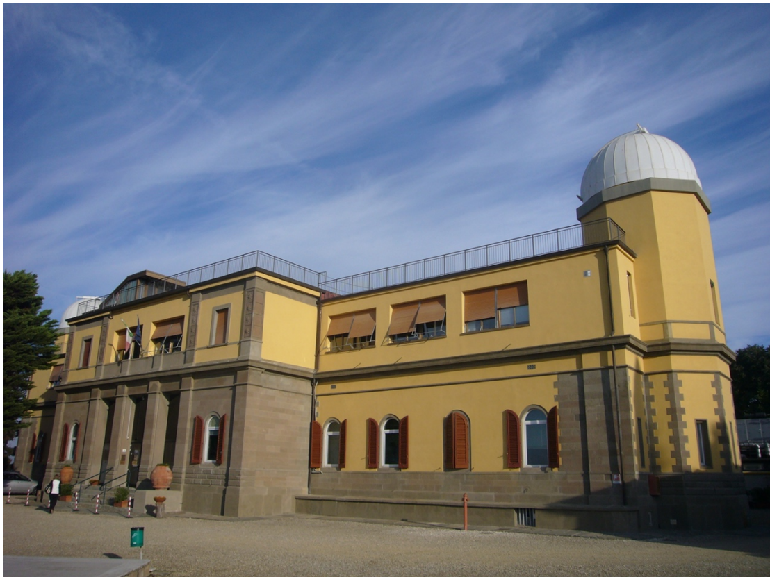
Fig. 8 L'Osservatorio Astrofisico di Arcetri oggi. Con i lavori iniziati alla fine degli anni '50 del XX secolo, l'edificio è stato innalzato di un piano in corrispondenza delle due terrazze laterali, e la cupola centrale è stata rimossa.