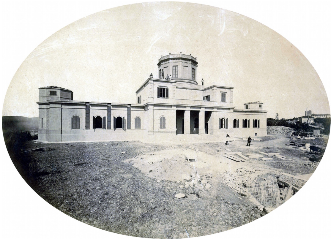
Fig. 2 Estate 1872: l'Osservatorio di Arcetri nelle ultime fasi della sua costruzione.