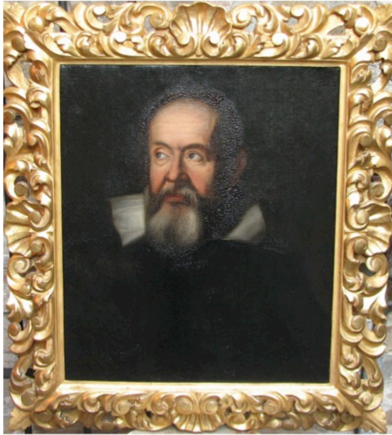
Fig. 4 Ritratto di Galileo Galilei (Osservatorio Astrofisico di Arcetri). Copia dell'opera di Justus Sustermans realizzata nel 1636 ed esposta nella Galleria degli Uffizi a Firenze.