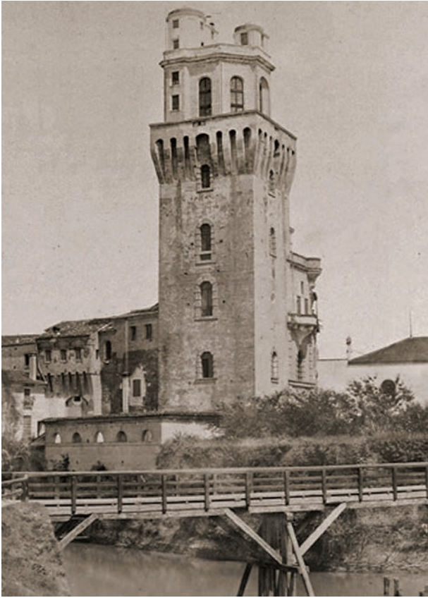
FIG. 1. La Specola padovana in una immagine degli anni '70 del XIX secolo.