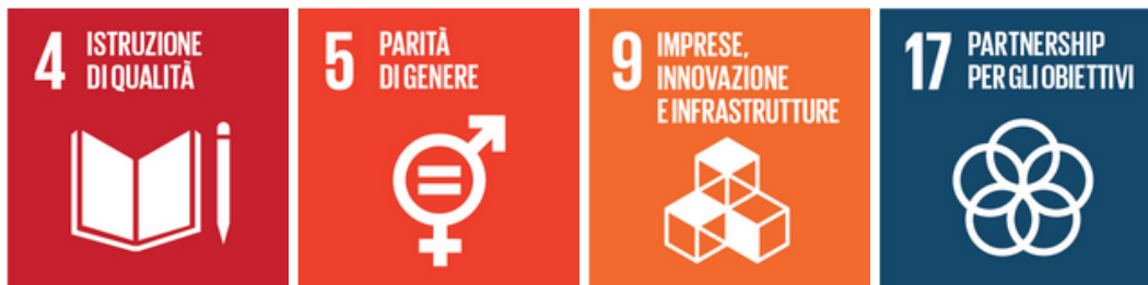
Figura 1. Gli obiettivi di sviluppo sostenibile dell'ONU scelti come prioritari per le nostre azioni, tra i 17 proposti.

Abbiamo scelto, come quelli più vicini al nostro agire: 4 - Istruzione di qualità; 5 - Parità di genere; 9 - Imprese, innovazione e infrastrutture; 17 - Partnership per gli obiettivi (si veda la Figura 1). Andranno inseriti nelle verifiche delle attività.