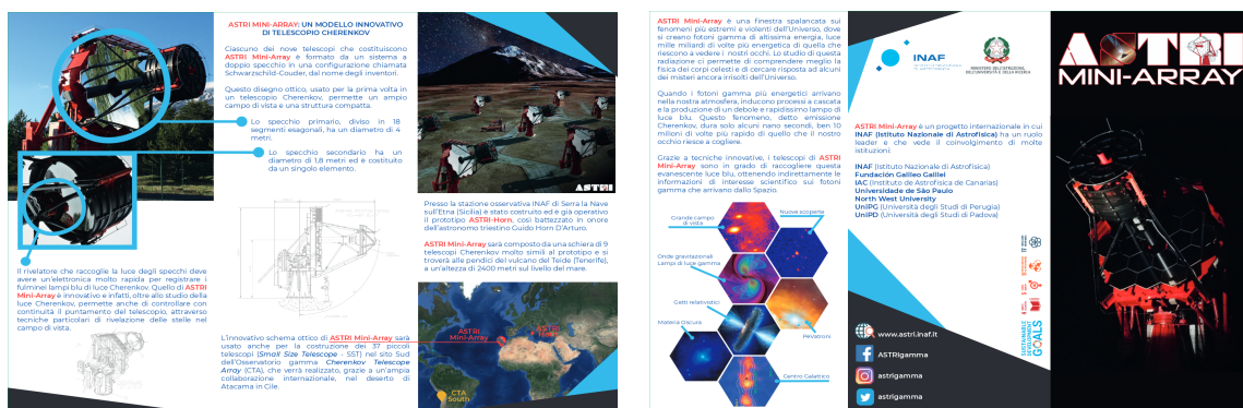
Figura 3. Le due facciate del volantino ASTRI

È in progetto l'aggiornamento non appena saranno disponibili le nuove immagini dei telescopi dell'ASTRI Mini-Array.