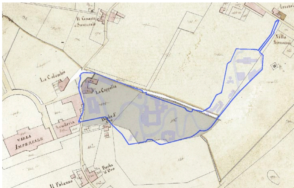
Figura 1. Mappe dal Catasto Generale Toscano, Comunità del Galluzzo, Sezione B, fogli 1, 4 e 6. In grigio il “Podere della Cappella”, in viola edifici, viabilità e confini catastali attuali del comprensorio di Arcetri. Immagini ottenute grazie al portale GEOscopio della Regione Toscana ( www.geografia.toscana.it ).

Figure 1. Maps of the General Tuscan Land Registry, Village of Galluzzo, Section B, sheet 1, 4 and 6. The “Podere della Cappella” is in grey, while buildings, roads and current cadastral borders of the Arcetri area are shown in purple. Images obtained from the website “GEOscopio della Regione Toscana” ( www.geografia.toscana.it ).