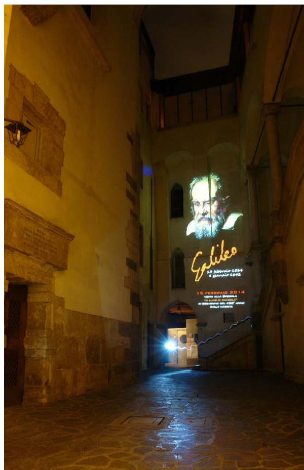
Il 15 febbraio 2014 si è festeggiato il 450° anniversario della nascita di Galileo con le visite a lume di candela