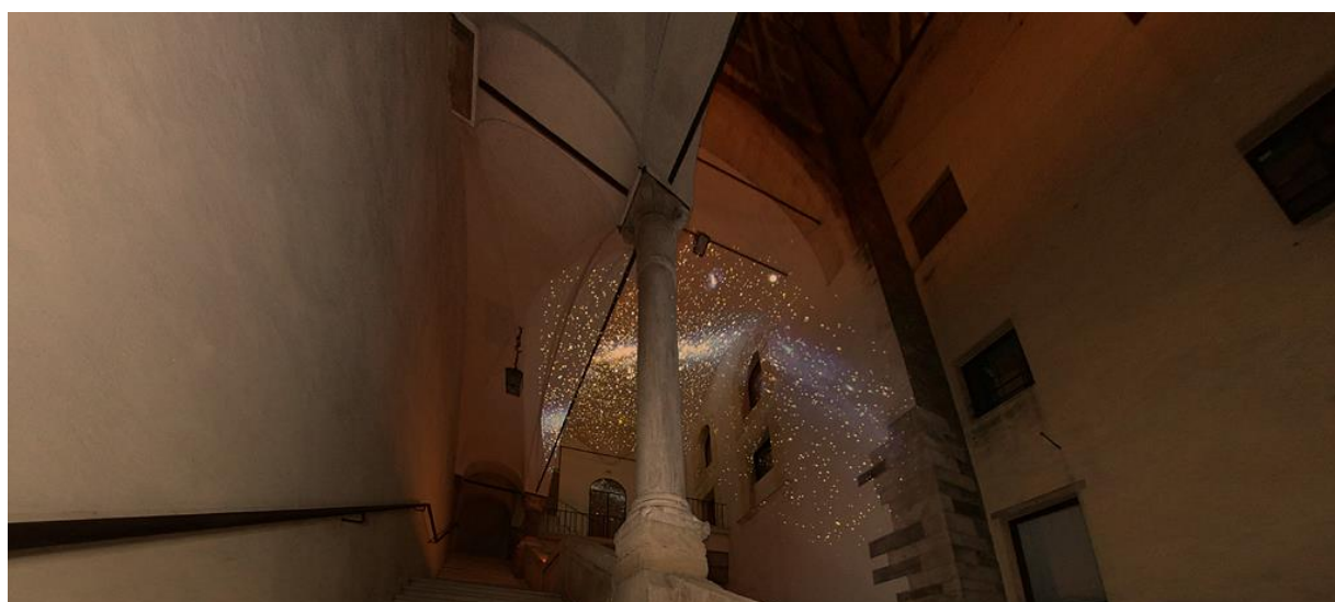
L'androne della Specola illuminato dalla raffigurazione della volta celeste, durante l'evento M'illumino di meno 2013

Le visite al Museo sono state riprese, seppur a regime ridotto, solo dall'estate 2021, ma a causa degli attuali protocolli di accesso non è ancora stato possibile riattivare le aperture in occasione di giornate od eventi speciali.