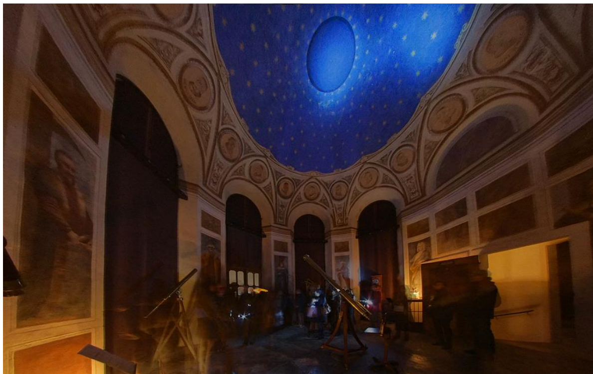
La sala delle figure con la volta illuminata dalle torce delle guide durante l'evento M'illumino di meno 2013