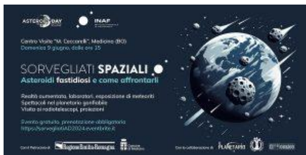
Figura 2. Locandina dell'evento Sorvegliati Spaziali - Asteroidi fastidiosi e come affrontarli III edizione.

Il resoconto dell'evento è pubblicato a questo link . L'iniziativa ha ricevuto il Patrocinio della Regione Emilia-Romagna e del Comune di Medicina (BO).