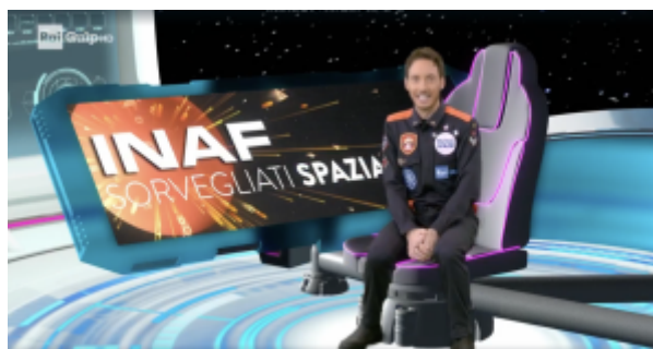
Figura 5. Frame rappresentativo della collaborazione di Sorvegliati Spaziali col programma Meteo Spazio di RAI Kids in onda su Rai Gulp.