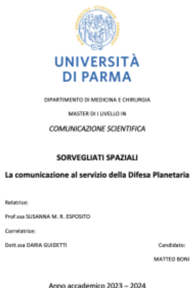
Figura 6. Frontespizio della tesi Sorvegliati Spaziali - La comunicazione al servizio della Difesa Planetaria di Matteo Boni (UniPR).