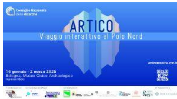
Figura 3. Una delle locandine della Mostra Artico. Viaggio interattivo al Polo Nord del CNR, XI edizione, che ha visto la collaborazione di INAF.