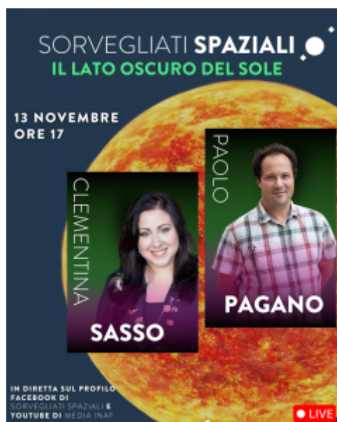
Figura 1. Locandina della prima live Sorvegliati Spaziali - Il lato oscuro del Sole , 13 novembre 2024.