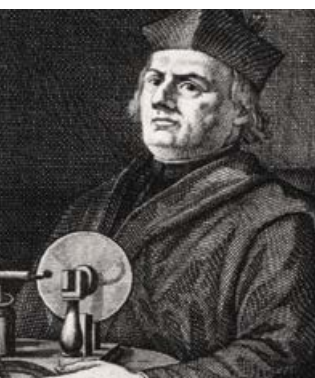
Giovanni Battista Beccaria