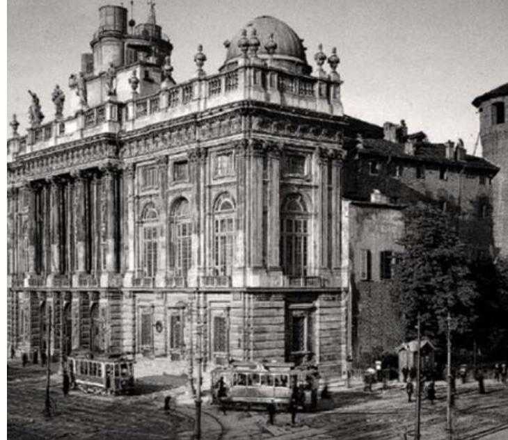
A sinistra: la torretta osservatorio di via Po. A centro pagina: la torretta dell'Osservatorio sull'Accademia delle Scienze e Giovanni Plana (statua nel Cimitero Monumentale)