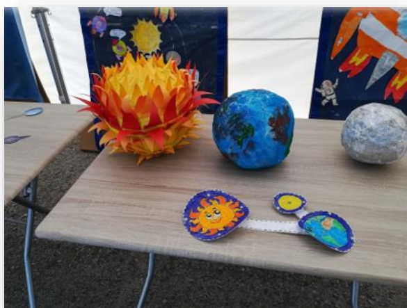
Nelle immagini seguenti (figure 7, 8, 9 e 10), alcuni momenti dell'evento finale del progetto:

Il piazzale esterno è stato invece dotato di tre gazebo autoportanti per esterni – gentilmente forniti dal Comune di San Basilio - per ospitare tavoli, pannelli ed esibizioni fatte a mano da bambini sotto la guida delle insegnanti. Gli exhibit prodotti erano vari e decisamente creativi: alcuni gruppi hanno deciso di creare grandi pannelli di cartone con rappresentazioni bidimensionali di costellazioni, quelle famose ma anche costellazioni completamente inventate; altri gruppi invece hanno riprodotto il nostro Sole e alcuni pianeti con la tecnica della cartapesta; altri gruppi ancora hanno invece deciso di puntare sul gioco, creando maxi puzzle a quadroni con immagini ispirate all'astronomia da ricomporre. Sicuramente da menzionare il tentativo di riprodurre una meridiana verticale per spiegare il concetto del trascorrere del tempo, o il pannello a finestrelle "L'alfabeto di Blu" con tutte le parole dell'astronomia associate alle lettere dell'alfabeto. Infine, un gruppo di bambini ha organizzato alcuni giochi di squadra atletici, con percorsi a ostacoli che terminavano con un puzzle astronomico da ricomporre, coinvolgendo anche i genitori.