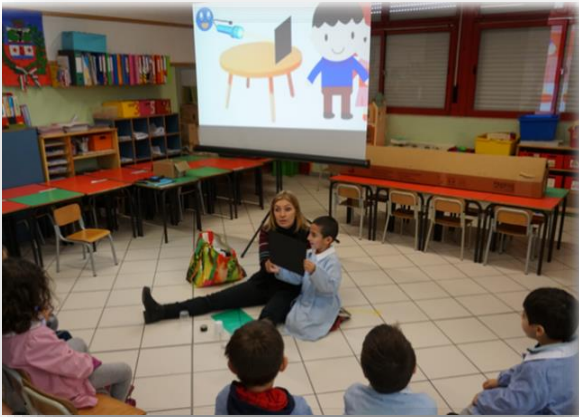
Figura 5 Qual è il significato di corpo opaco? E cosa significa trasparente? I bambini esplorano le proprietà dell'interazione radiazione-materia