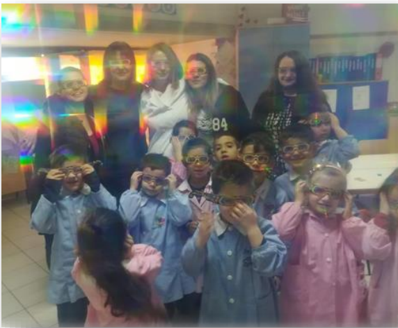
Figura 6 Giochiamo con la luce!