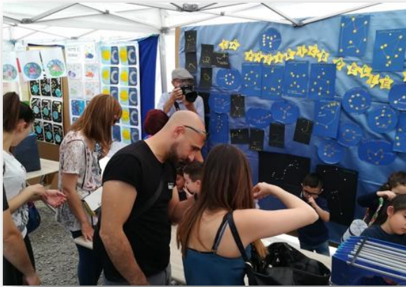
Figura 9 Genitori esplorano il pannello sulle costellazioni. Sullo sfondo il pannello sul giorno e la notte