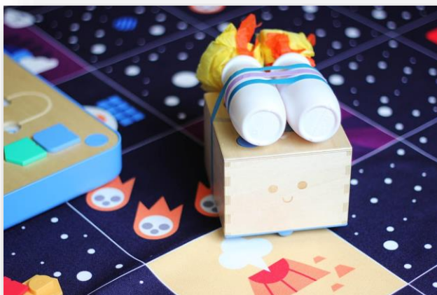
Figura 11 Cubetto allestito per la missione di recupero di Blu

Come esempio, abbiamo progettato e realizzato un'attività aggiuntiva dedicata all'introduzione al pensiero