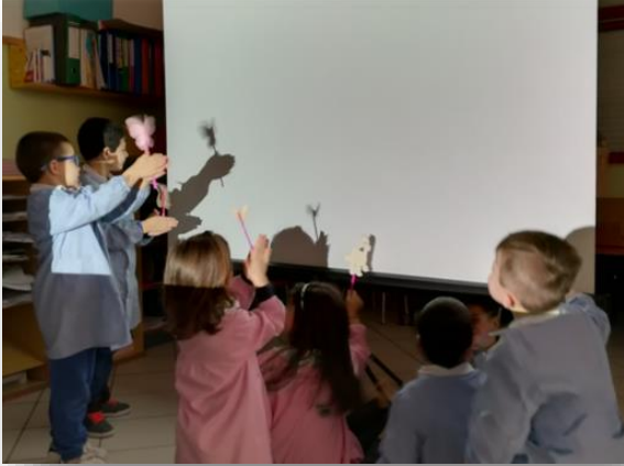
Figura 4 I bambini spiegano le ombre a Blu. Alcuni bambini hanno deciso di creare delle sagome di cartone da utilizzare per raccontare una storia a Blu. Durante la rappresentazione, i bambini scoprono in modo naturale le proprietà fisiche delle ombre.