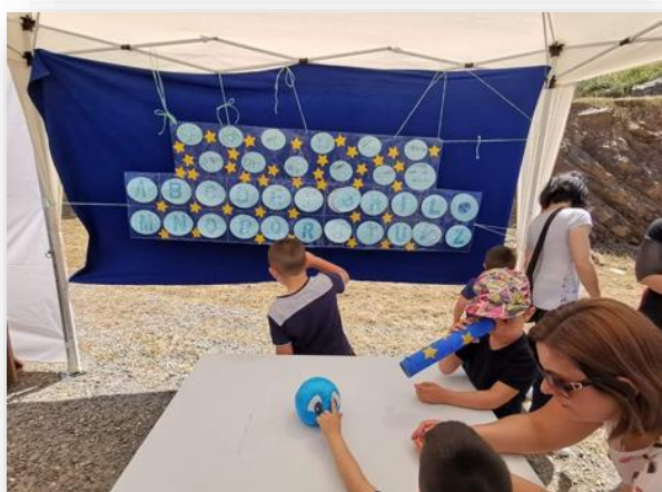
Figura 8 Il maxi pannello con l'Alfabeto astronomico di Blu