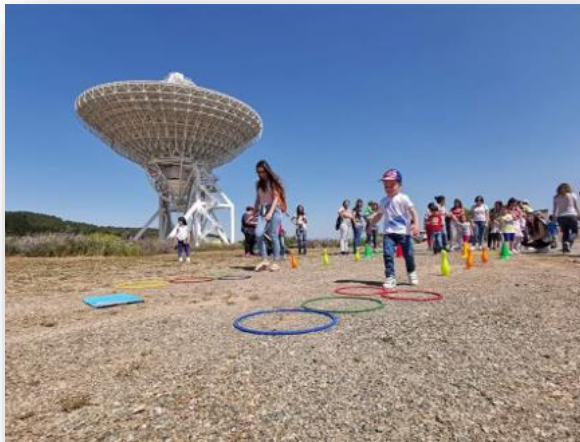
Figura 10 Le "olimpiadi" astronomiche. Nello sfondo il Sardinia Radio Telescope (SRT)