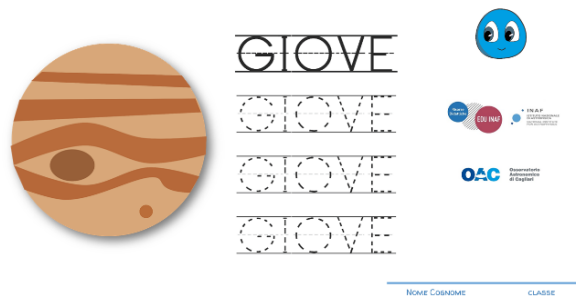
Figura 3 Scheda di pregrafismo sulla parola Giove in stampatello maiuscolo

Il progetto, dopo i 4 incontri in classe, si è concluso all'inizio di giugno 2019 con una visita presso la sede dell'Osservatorio di Cagliari (e la visione di uno spettacolo sul Planetario creato appositamente come un videomessaggio inviato da Blu che, dopo aver interagito con i bambini, decide di esplorare i pianeti del Sistema Solare) e un evento globale finale condotto presso il sito del Sardinia Radio Telescope.