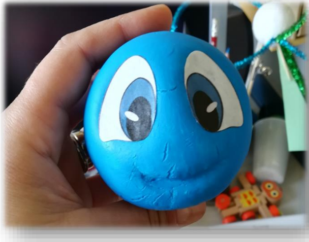
Figura 2 Il pupazzetto di Blu (versione piccola)

L'identificazione e l'empatia tra Blu e i bambini vengono inoltre promosse dall'uso, durante la narrazione, agevolata da slide, di un pupazzetto di Blu. Al momento sono state prodotte due versioni di Blu, entrambe di materiale plastico atossico: una piccola e morbida (vedi Fig. 2) e una più grande e dura, più pesante ma anche molto più semplice da tenere pulita, che hanno funzionato da prototipi per capire quali materiali e/o dimensioni fossero più vantaggiosi nell'interazione con i bambini. Sono attualmente in fase di studio varie altre possibilità sotto forma di pupazzetto morbido.