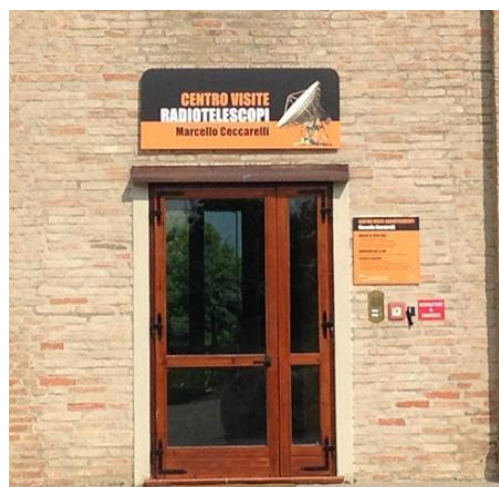
Figura 10 Ingresso del Centro Visite.

Per l'ingresso del Centro Visite al piano terra sono stati realizzati: un pannello grande (150x60 cm), posizionato sopra la porta di accesso, per evidenziarla rispetto alle altre porte che danno sull'aia esterna;