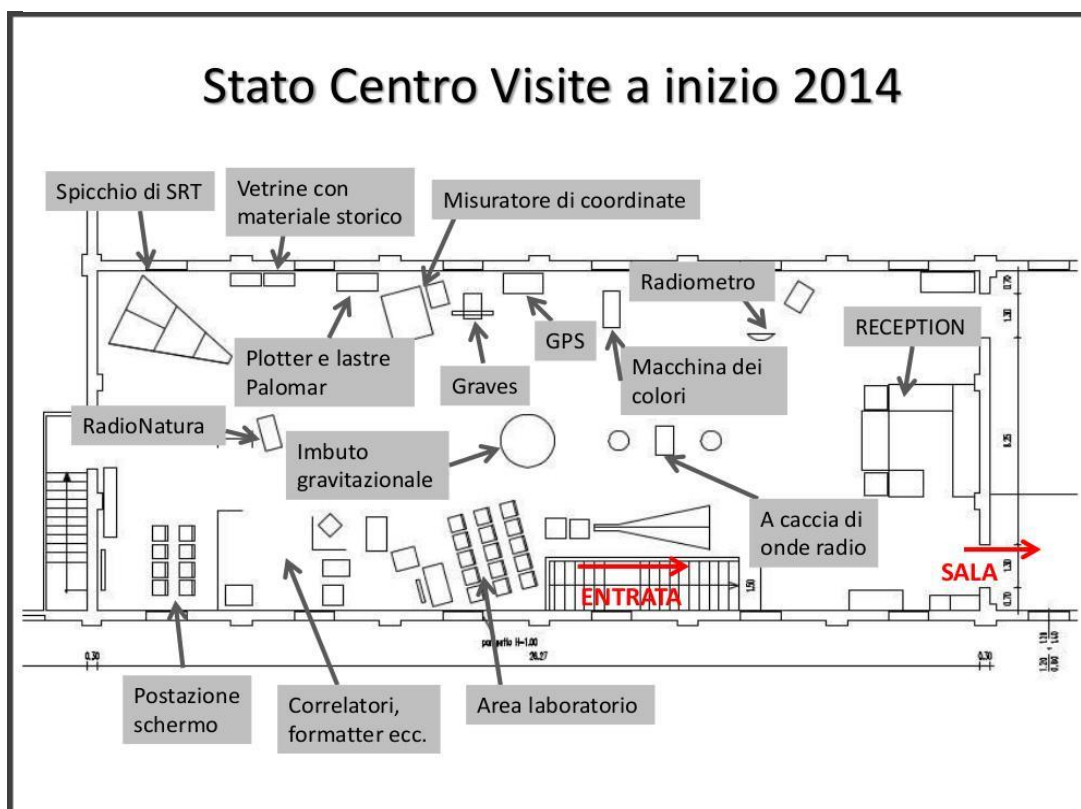
Figura 2. Schema dell'allestimento a fine 2013, in pianta vista dall'alto.