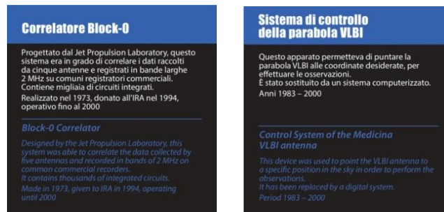
Figura 8 Pannelli di formato 20x20 cm per la descrizione della strumentazione.

I pannelli in formato piccolo hanno infine dimensione 20x20 cm e sono usati per la descrizione della strumentazione storica, quindi sono di colore blu (Figura 8). Tre di questi pannelli descrivono anche la strumentazione dell'exhibit A caccia di onde radio : trasmettitore, ricevitore e rivelatore.