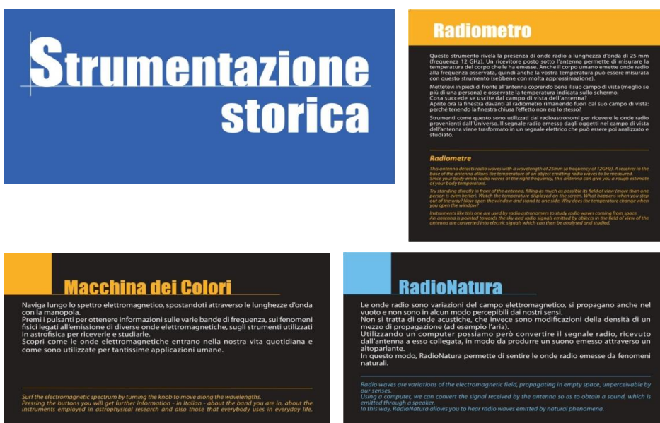
Figura 7 Pannelli di formato medio in uso nell'esposizione: 60x30 e 40x40 (in alto) e 50x30 (in basso).

I pannelli di formato medio sono quelli che descrivono exhibit e postazioni in mostra; variano in colore coerentemente con l'area di riferimento in cui sono collocati e hanno formati diversi legati all'esigenza di minimizzare le modifiche alle strutture esistenti. Sono considerati di questo formato anche i pannelli distintivi delle 4 aree tematiche, tutti alti 30 cm e rettangolari (Figura 7).