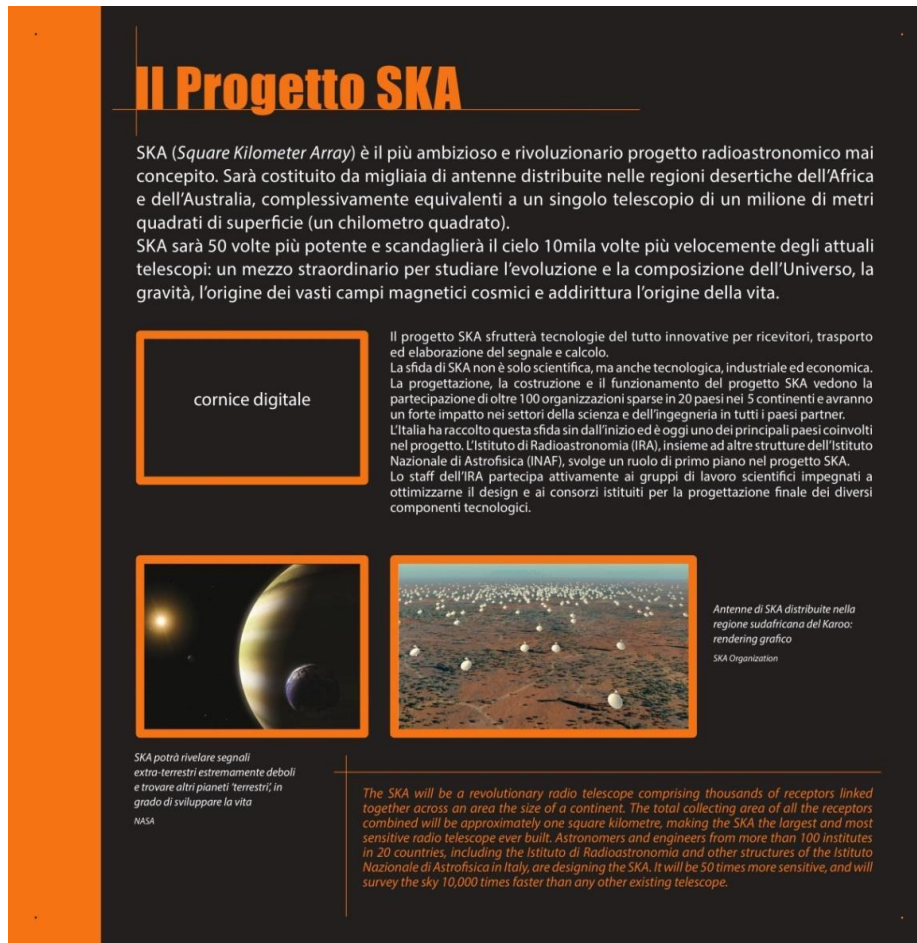
Figura 6 Pannello dell'area Progetti di ricerca, in formato 85x85 cm, con indicazione dell'alloggiamento per la cornice digitale.

I pannelli di formato medio sono quelli che descrivono exhibit e postazioni in mostra; variano in colore coerentemente con l'area di riferimento in cui sono collocati e hanno formati diversi legati all'esigenza di minimizzare le modifiche alle strutture esistenti. Sono considerati di questo formato anche i pannelli distintivi delle 4 aree tematiche, tutti alti 30 cm e rettangolari (Figura 7).