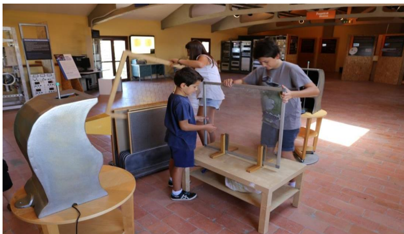
Figura 11 Utilizzo interattivo dell'exhibit A caccia di onde radio .

Il testo dei pannelli è diviso in sezioni con font di diversa dimensione e con diverso grado di dettaglio. Le cornici digitali contengono video con livello di dettaglio ancora maggiore e una diversa narrativa. Gli exhibit e le postazioni permettono una fruizione apprezzabile in termini di completezza di messaggio, sia attraverso un approccio rapido e generico, sia a seguito di un'esperienza più rilassata e minuziosa, grazie alle sezioni di approfondimento Dimmi di più o alle proposte per un'interazione più attenta e partecipata (Figura 11).