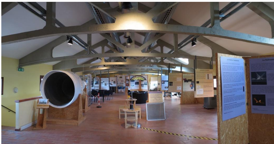
Figura 1 Vista panoramica della sala esposizione a fine 2013.

A fine 2013, l'allestimento della sala esposizione del Centro Visite si presentava come in Figura 1, di cui è riportato uno schema in pianta in figura 2, in cui sono indicate le posizioni delle singole postazioni e degli exhibit.