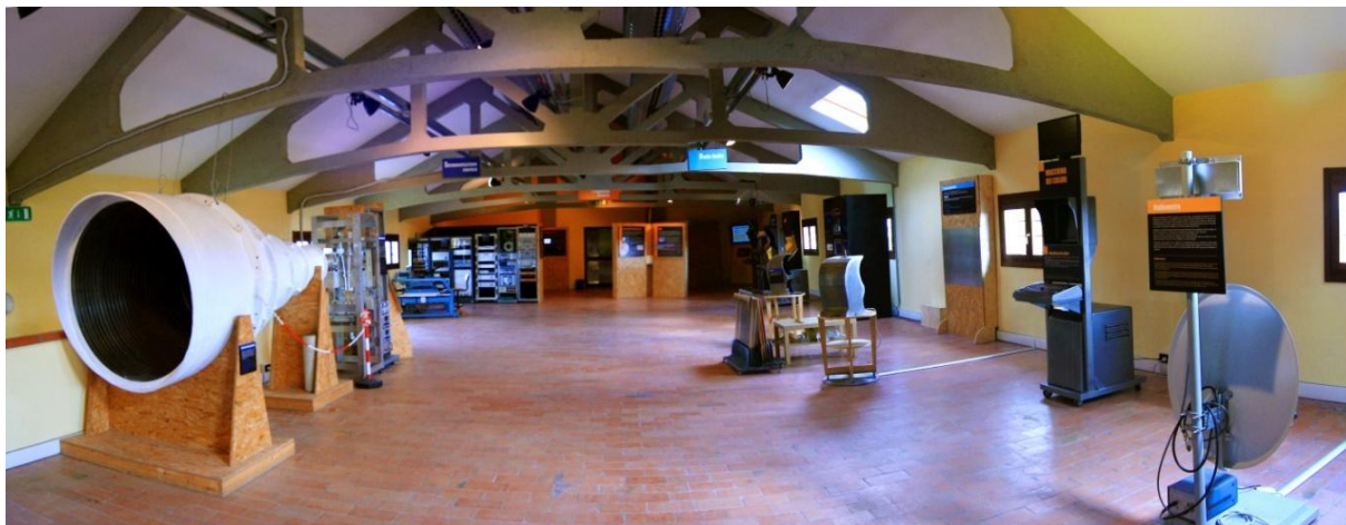
Figura 3 Vista panoramica del nuovo allestimento del 2014.