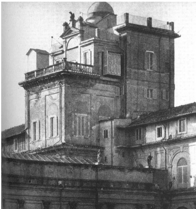
La Torre dei Venti, primo sito della Specola Vaticana, come appariva alla fine del XIX secolo.

La missione della Specola, dunque, continua e si apre verso orizzonti sempre nuovi, nello spirito che ha sempre contraddistinto la Compagnia di Gesù: Ad maiorem Dei gloriam .