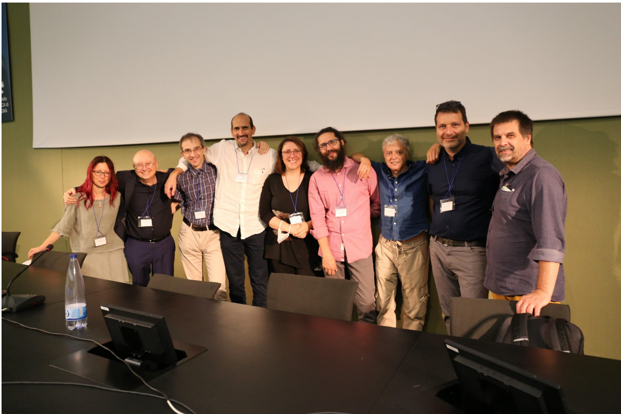
Figure professionali dei Ricercatori e Tecnologi

E' stata data grande evidenza alla necessità di formare e valorizzare le figure professionali di quest'area. E' opportuno che la valorizzazione professionale si concretizzi sia attraverso adeguate opportunità di carriera che con il riconoscimento del contributo al ritorno scientifico.