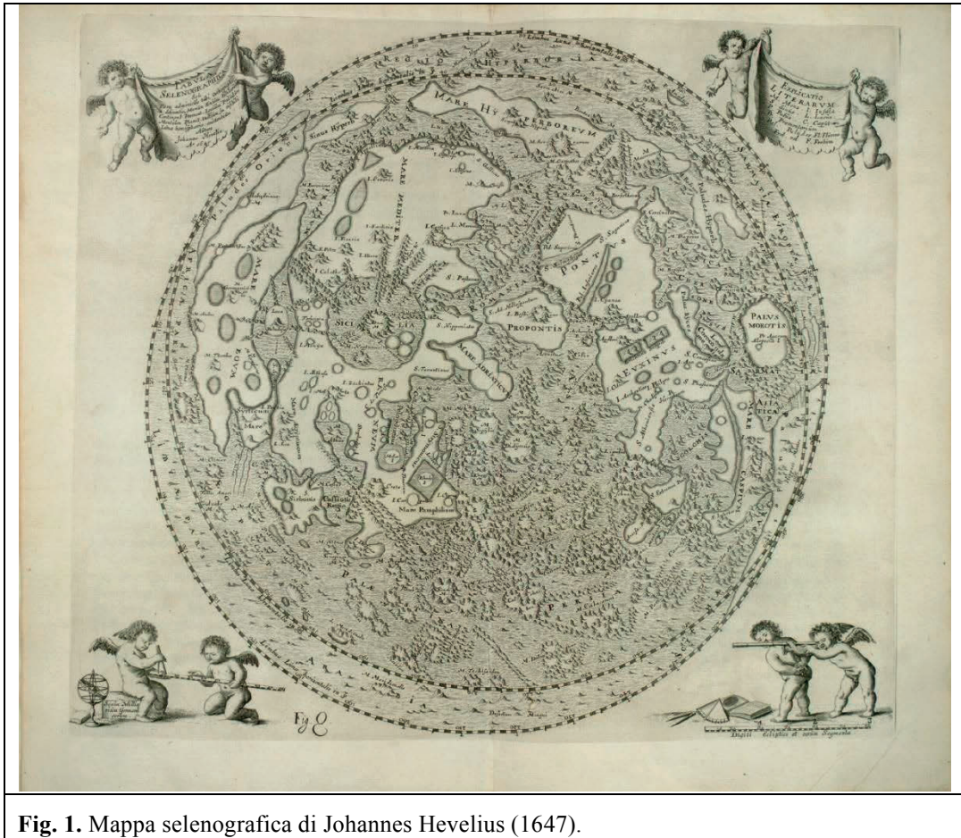
Fig. 1. Mappa selenografica di Johannes Hevelius (1647).