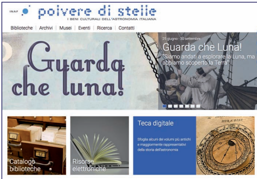
Figura 1. Il portale dell'INAF Polvere di stelle. I beni culturali dell'astronomia italiana

Dal 2013 INAF si è impegnato ad attuare un progetto sistematico, un vero e proprio MAB astronomico, che ha portato alla realizzazione di Polvere di Stelle , il Portale dei beni culturali astronomici italiani 1 , il sito web che raccoglie i database archivistici, bibliografici e strumentali di tutti i beni culturali INAF (Fig.1). Il portale costituisce uno strumento informatico che consente agli studiosi ricerche simultanee su tutti i database delle differenti tipologie di materiale storico ed è arricchito sia dalla presenza di una Teca digitale, che permette la consultazione di un primo nucleo di volumi rari e di pregio e di particolari fondi archivistici, sia dal database delle biografie degli astronomi italiani.