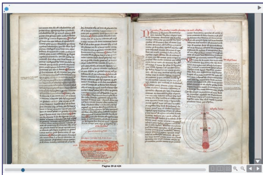
Figura 2. Tractatus De Spera di Sacrobosco all'interno della Teca Digitale di Polvere di stelle (Osservatorio astronomico di Roma)

Il criterio seguito nell'individuazione dei volumi da digitalizzare è stato di tipo cronologico. Partendo dalle testimonianze più antiche e più preziose possedute da INAF, la scelta è caduta innanzitutto su un codice manoscritto della seconda metà del XIV secolo conservato presso la Biblioteca antica dell'Osservatorio di Roma a Monte Mario: una raccolta di 17 testi "classici" di astronomia molto diffusi in epoca tardo medievale che formano una sorta di compendio di astronomia ad uso probabilmente universitario (Fig.2). Sono stati poi selezionati testi pubblicati nel Cinquecento e nel Seicento che non fossero già disponibili online. È stata fatta qualche eccezione nel caso in cui gli esemplari posseduti avessero un particolare valore e caratteristiche di unicità da un punto di vista culturale o iconografico. Come, ad esempio, per l'edizione del 1543 posseduta dall'Osservatorio di