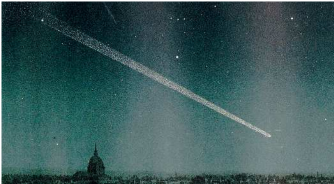
a sinistra La grande comète de 1843, E. Guillemin, Les comètes (1875)