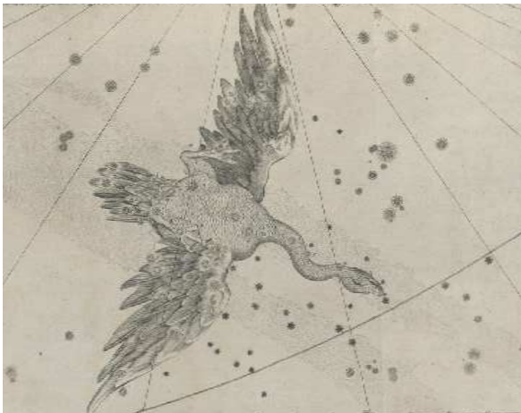
a pagina 14 Ursa Minor, J. Hevelius, Prodromus astronomiae (1690)