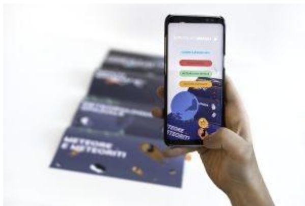
Figura 3. Rappresentazione dell'uso dell'app AR Sorvegliati Spaziali tramite un dispositivo mobile per attivare i contenuti di realtà aumentata dalla brochure del progetto sullo sfondo.

Queste esperienze offrono un'immersione completa nelle dinamiche spaziali, consentendo agli utenti di esplorare visivamente e sonoramente i fenomeni scientifici legati alla Difesa Planetaria.