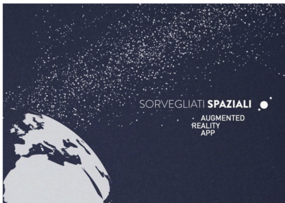
Figura 2. La copertina (in alto) e una delle pagine interne (in basso) della brochure Sorvegliati Spaziali."

La narrazione prende vita fin dalla copertina, che raffigura la Terra circondata da una scia di elementi visivi suscettibili di molteplici interpretazioni: le stelle della Via Lattea, i rifiuti spaziali in orbita terrestre bassa o la Fascia Principale degli Asteroidi, fonte di asteroidi potenzialmente pericolosi. Il messaggio trasmesso è che la Terra, protagonista di questo scenario cosmico, deve essere protetta (l'illustrazione continua anche sul retro della copertina).