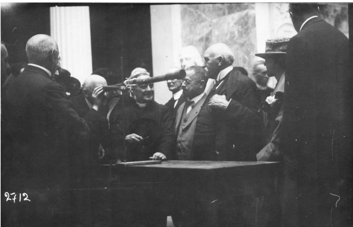
FIGURA 5: Durante la visita alla Specola fiorentina i congressisti posano l'occhio al cannocchiale di Galileo.