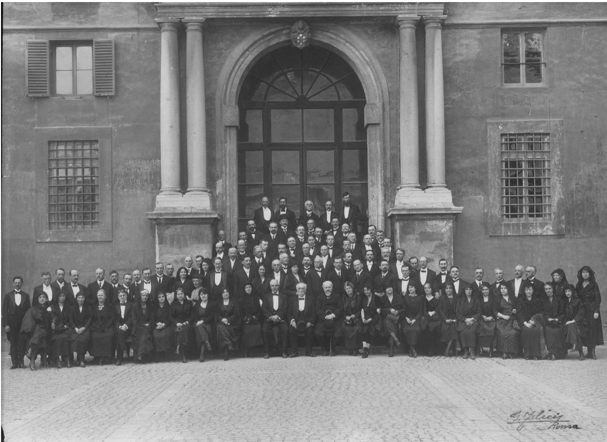
FIGURA 4: Foto di gruppo dei congressisti e consorti, dopo l'udienza con Papa XI.