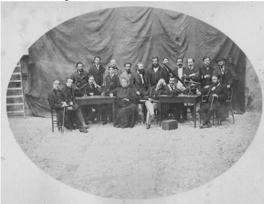
FIGURA 1: Foto di gruppi dei partecipanti alla spedizione italiana per l'osservazione dell'eclisse totale di Sole del 1870, nella stazione di Augusta. Padre Angelo Secchi è seduto al centro, con il cappello in mano.