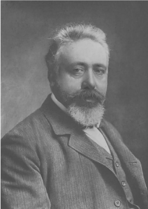
FIGURA 2: Vito Volterra (1860-1940).