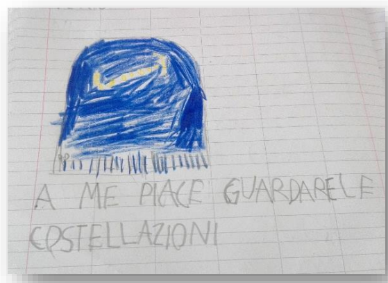
Figura 6 "A me piace guardare le costellazioni" (Costellazione dello Scorpione; cit. Lorenzo)

(Leonardo, 7 anni, commentando i miti legati alle costellazioni)