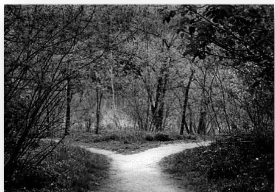
Figura 3 Dove sarà il nord? Strada a destra o a sinistra?

"rientrando, quando trovate il bivio, prendete la strada che va a Nord".