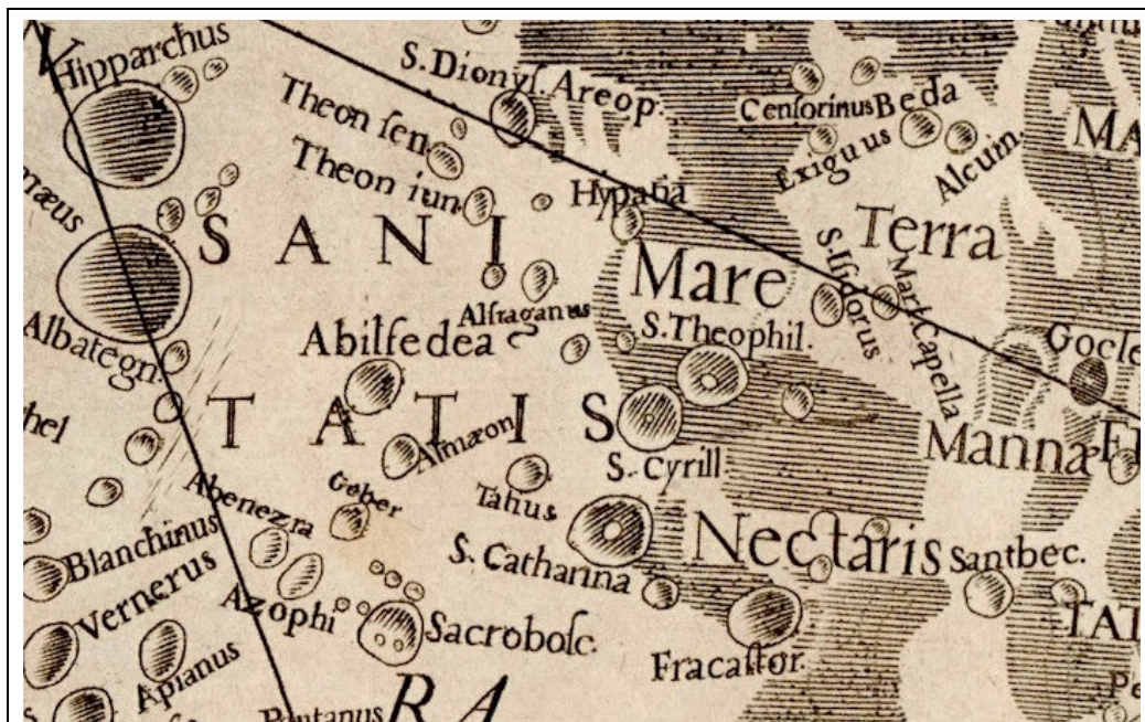
Fig. 2. Dettaglio della mappa, nel quale sono evidenti i due crateri Hypatia e S. Catharina.

Quel che è certo, comunque, è che per Riccioli l'astronomia fiorì pienamente con la cultura greca, in particolare nel periodo ellenistico. Dopo il giusto tributo a personaggi classici come Talete, Anassimandro, Anassimene e Pitagora, che troviamo tra il I e il II ottante, Riccioli riserva il massimo della sua attenzione alla scuola di Alessandria, per lui vera culla dell'astronomia moderna. Al centro del disco lunare dominano infatti i crateri dedicati a Ipparco e Tolomeo, considerati da Riccioli e da tutti gli studiosi dell'epoca i veri pilastri della scienza astronomica e quindi collocati, non a caso, proprio in questa posizione. Tutto attorno, vi sono gli altri grandi nomi della cultura ellenistica, i più antichi nel I e II quadrante (Aristillo, Timocari, Eratostene, Conone), gli altri tra il V e il VI ottante, ben distribuiti tra la Terra Sanitatis , il Mare Nectaris e al confine con la Terra Mannae , nomi che evocano un'epoca di prosperità e abbondanza. Proprio qui sono presenti le uniche due donne alle quali Riccioli dedica un cratere lunare: Hypatia e S. Catharina (Fig. 2).