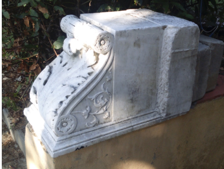
Figura 5: Mensola di marmo, oggi all'ingresso della casa del custode dell'Osservatorio. Per le sue dimensioni, potrebbe essere la mensola preparata per il busto.

stabilità, fu quindi deciso, sempre in accordo con lo scultore, evidentemente attento al decoro della sua creazione, di porre il busto su un piedistallo in legno al centro della sala centrale, eventualmente circondato da un sedile. Ma anche questa soluzione fu abbandonata, e si optò per un'intelaiatura di metallo e legno da porre davanti ad una porta interna della sala del meridiano. E lo scultore questa volta non sembrò essersi opposto, forse pago - o semplicemente rassegnato - di veder finalmente collocata la sua opera, il 4 dicembre 1899 35 .