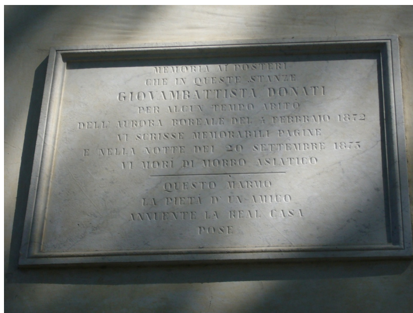
Figura 2: Lapidè posta sopra l'ingresso della Villetta della Cappella (oggi nota come Villino Donati ), all'ingresso principale dell'Osservatorio di Arcetri.

Forse nello stesso periodo, un anonimo amico fece apporre una seconda lapide sulla facciata della Villetta della Cappella ( Fig. 2 ).