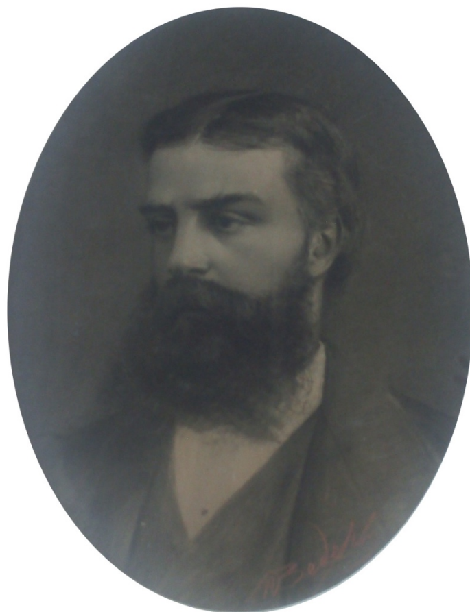
Figura 1: Ritratto a carboncino di Giovan Battista Donati, tratto da una fotografia di Giacomo Brogi (riprodotta in «Giornale di Astronomia», 2012, 2, p. 5). Biblioteca dell'Osservatorio di Arcetri.