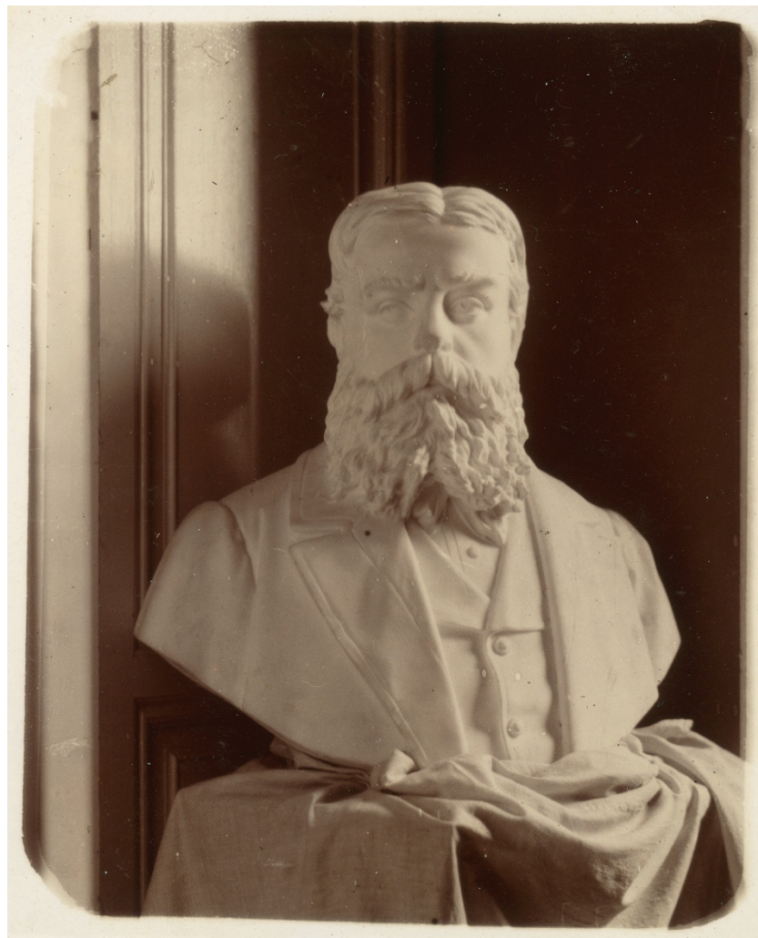
Figura 4: Il busto nel 1899 poco prima della collocazione, da un album fotografico della famiglia Abetti.

Comitato si risvegliò 33 . Nuovi ritardi furono però causati dall'indecisione su dove porre l'opera. Inizialmente era previsto di montare il busto su una mensola sopra la porta d'ingresso alla sala centrale dell'Osservatorio; si scelse una mensola di ferro ricoperta di stucco, ma Lucchesi si oppose a questa soluzione e richiese una mensola di marmo. Busto ( Fig. 4 ) e mensola ( Fig. 5 ) furono finalmente ricevuti all'Osservatorio di Arcetri nel giugno 1896, con un trasporto organizzato dallo stesso scultore 34 .