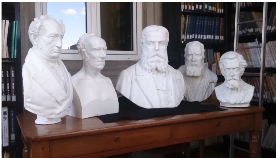
Figura 10: Il busto in marmo di Donati (al centro) insieme ai busti in gesso di Giovanni Antonio Amedeo Plana (1781-1864), Giovanni Battista Amici (1786-1863), Galileo Galilei (1564-1642) e Giovanni Virginio Schiaparelli (1835-1910) (da sinistra a destra). Tutti di proprietà dell'Osservatorio, i busti sono stati riportati ad Arcetri nel giugno 2015.