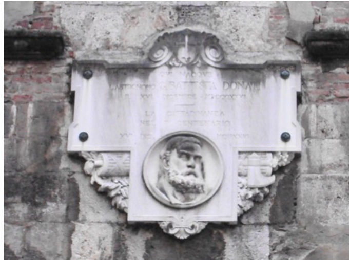
Figura 7: La lapide in piazza Donati a Pisa: L'iscrizione recita: QUI NACQUE/ L' ASTRONOMO G.BATTISTA DONATI/ IL XVI - DICEMBRE - MDCCCXXXVI/ LA CITTADINANZA/ NEL I° CENTENARIO/ XVI DIC. MCMXXVI.

I resoconti sulle celebrazioni del centenario non fanno alcuna menzione dei vecchi propositi riguardanti la sepoltura di Donati. Che accadde a quella tomba "su cui cresce l'erba e passano le stelle in silenzio"? Nel 1893-4 il Comitato per il monumento ed il proposto della chiesa di S. Felice a Ema avevano convenuto di lasciare indisturbati i resti dell'astronomo, spostandone la lapide in un luogo più consono all'interno del cimitero, dopo averne dorate le lettere e aggiunta un'effigie 56 . Ancora nell'ottobre del 1904, il segretario Costantino Pittei scriveva al Proposto per pregarlo di ripulire e colorare l'iscrizione funeraria, a spese del Comitato 57 . È questa l'ultima traccia documentaria che abbiamo trovato della lapide, mentre non siamo ancora riusciti a localizzarla nel cimitero, se mai esiste ancora 58 . Triste epilogo per quel luogo che avrebbe dovuto essere "sempre un punto di convegno per quanti amano il proprio paese, e serbano venerata memoria di quegli egregi che a forza di studio e di lavoro contribuiscono al progresso della scienza" 59 .