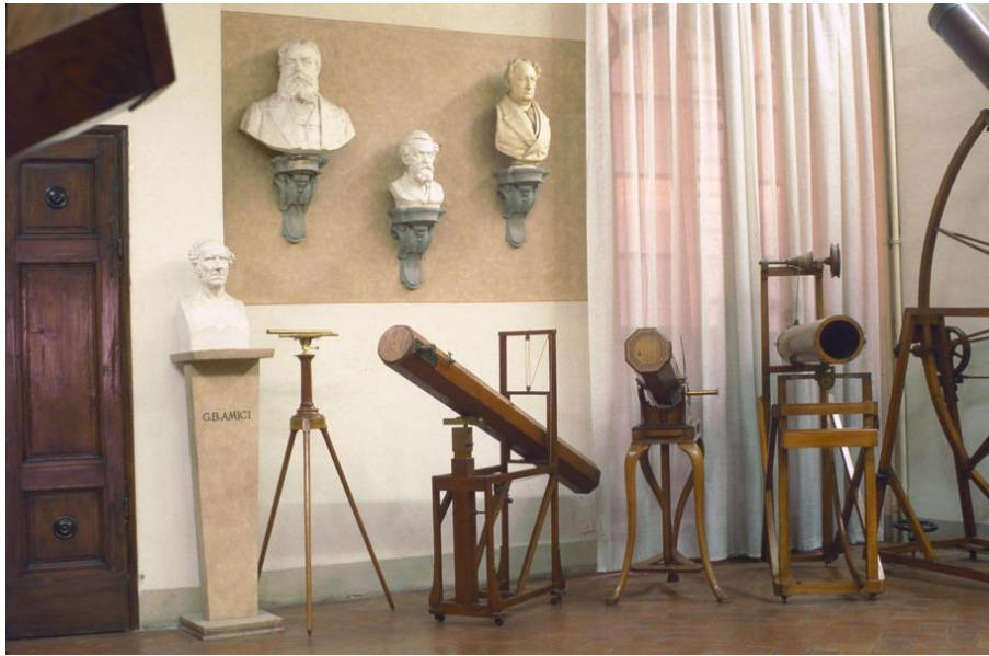
Figura 9: La sala dei telescopi del Museo di Storia della Scienza (1973-1975; per gentile concessione del Museo Galileo, Firenze).