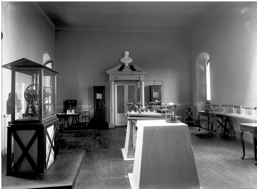
Figura 8: La sala del meridiano (2/1/1936;).