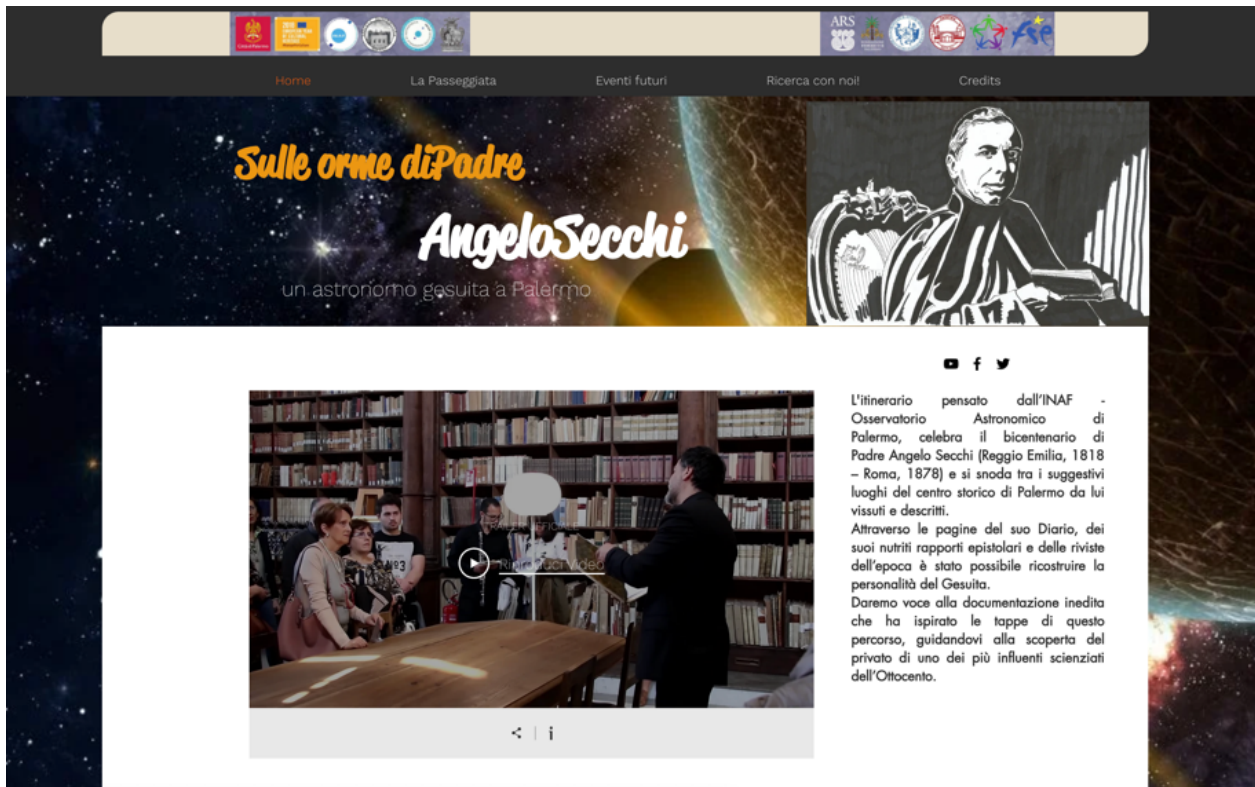
Fig. 1 – Home page

Saltiamo la pagina La passeggiata , la approfondiremo nella sezione 3 del presente report. La pagina Eventi futuri mostra tutti gli eventi organizzati in occasione del bicentenario dall'Inaf di Palermo, mentre la pagina Ricerca con noi! invita gli utenti a condividere curiosità, documenti e scoperte legate alla figura di Angelo Secchi. Infine, nella pagina Credits , sono riportati tutti i nomi delle persone che a vario titolo hanno lavorato alla passeggiata astronomica.