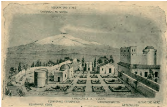
Fig. 8. L'Osservatorio Astrofisico di Catania

Nel 1890 l' Osservatorio di Catania (Fig. 8) acquisì la denominazione di Osservatorio Astrofisico , il primo in Italia ad essere denominato “astrofisico” anziché “astronomico”, quasi a voler indicare fin dal nome la natura delle ricerche che si sarebbero svolte, distinguendosi in tal modo dagli osservatori astronomici tradizionali.